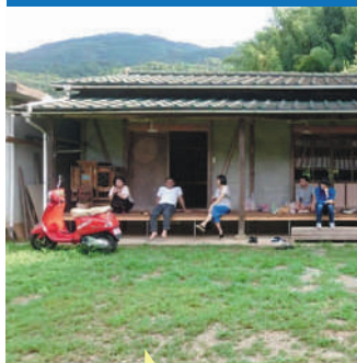
ゲストハウス等宿泊施設の運営業務