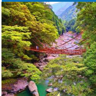
徳島県内各観光地での観光業務