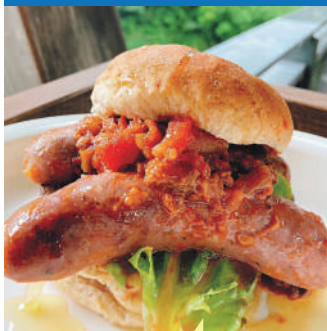
地場産品を使用した飲食店での業務