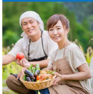
農家や農業法人での農作業

応募可能な企業や業務内容など、詳細は「徳島県ふるさとワーキングホリデー」のHPからご確認ください！▶