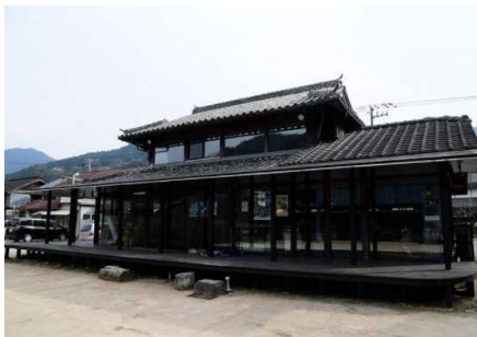
えんがわオフィス