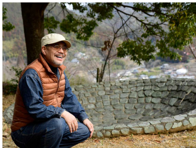
大栗山アートウォーク